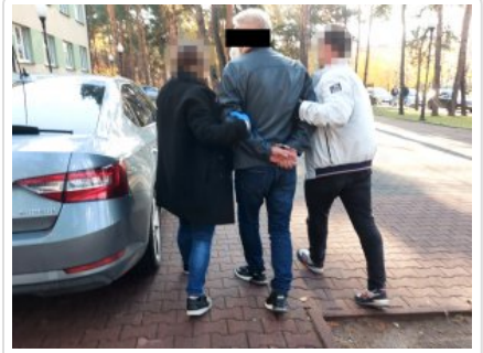
Policjant z zatrzymanym