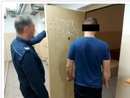
Policjant z zatrzymanym