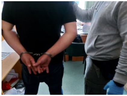
Policjant z zatrzymanym