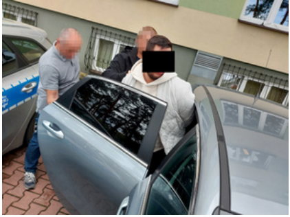
Policjanci z zatrzymanym