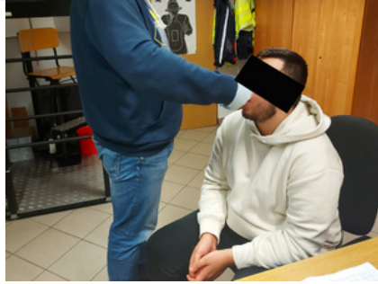
Policjant z zatrzymanym