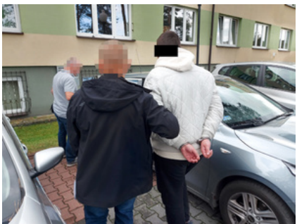
Policjant z zatrzymanym