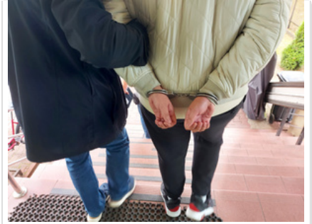
Policjant z zatrzymanym