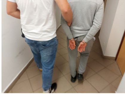
Policjant z zatrzymanym