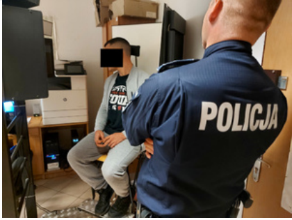
Policjant z zatrzymanym