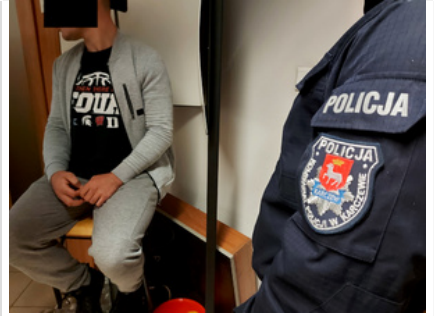
Policjant z zatrzymanym