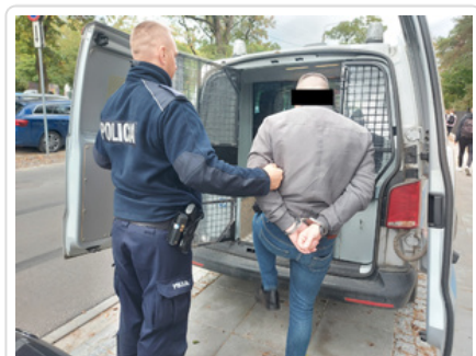
Policjant z zatrzymanym