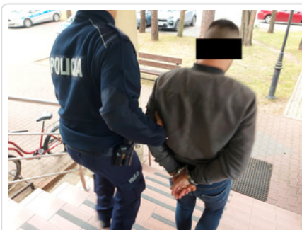
Policjant z zatrzymanym